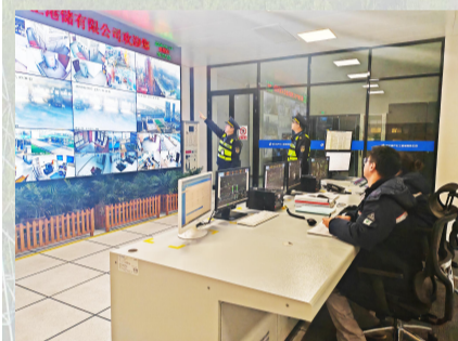
集中组织开展隐患排查整治,督促运输经营者严格落实安全生产主体责任,

对从业人员安全培训和交通运输工具技术状况检查维护情况进行检查,避免交通运输工具技术状况不良、带病运行。指导督促客运站严格执行出站检查、营运客车安全例检等制度,落实“三不进站、六不出站”安全管理责任。